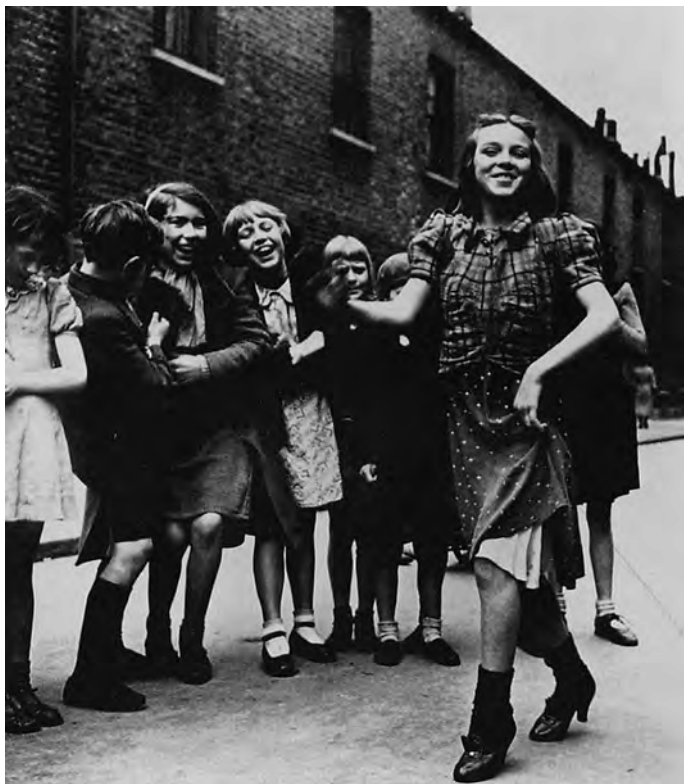
LÁNY „LAMBETH WALK“-OT TÁNCOL AZ EAST ENDEN, London, 1930