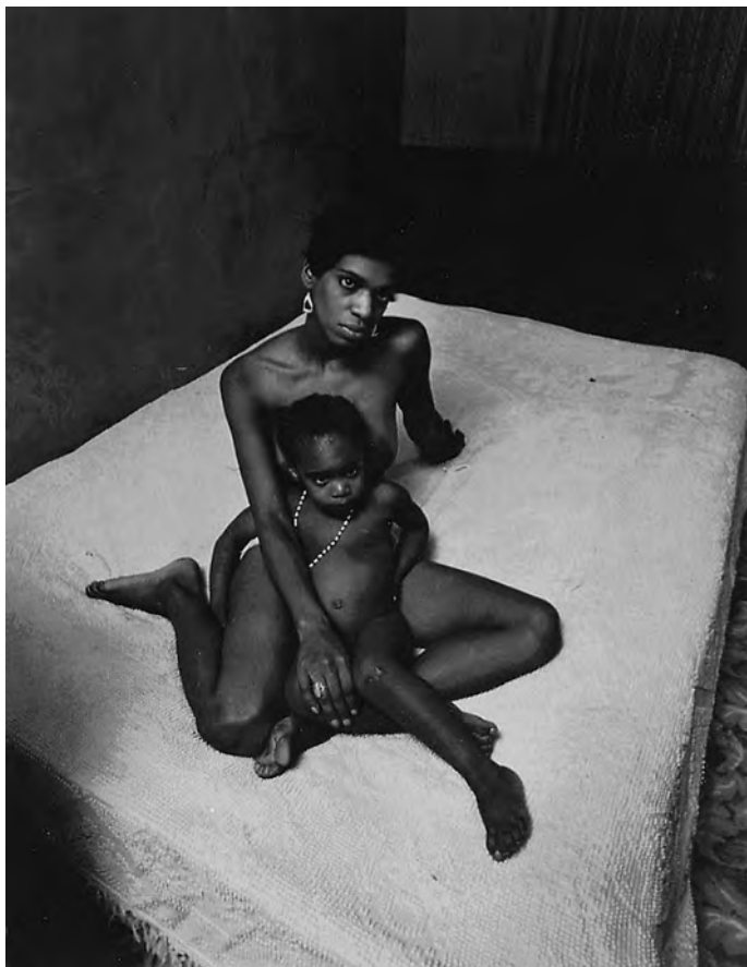
KELETI 100. UTCA, New York, 1968