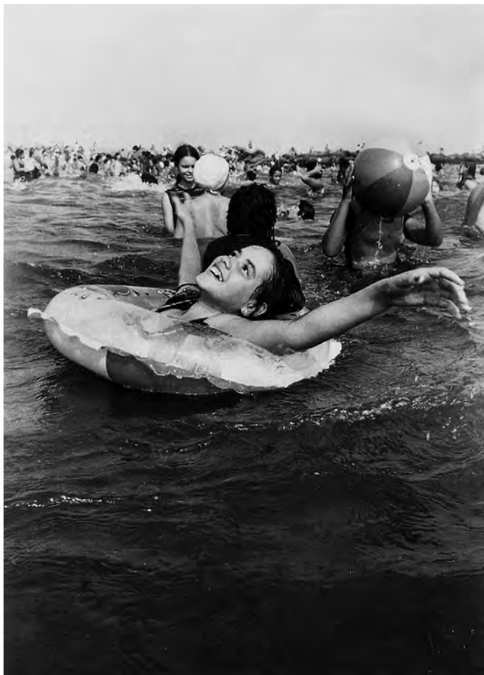
CONEY ISLAND, New York, 1974