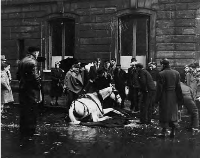
ELESETT LÓ, Párizs, 1942

»EXTRÉM felfegyverkezett ségünk védtelenné tesz minket a gyengeség határáig, gyengévé az értelem határáig, és értelmessé – a szorongás határáig«