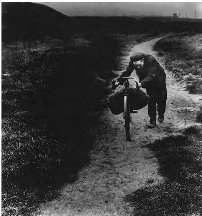
SZÉNÁNYÁSZ ÚTBAN HAZAFELÉ JARROW-BA, Anglia, 1930