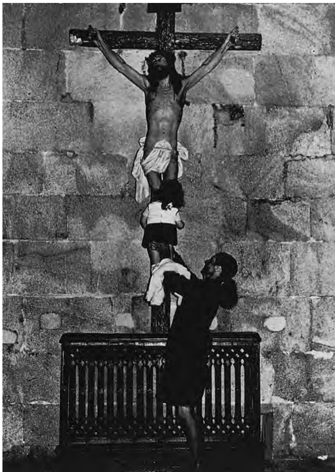
A CSÓK, Spanyolország, 1980