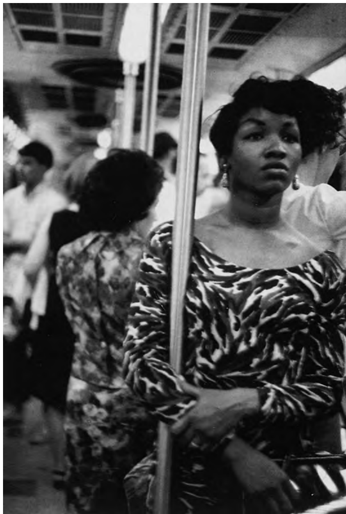
New York, 1964